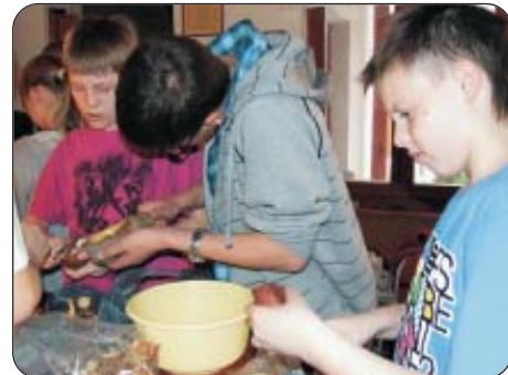
A fiúk is küzdenek

Petőfi Sándor Általános Iskola 7. a osztálya