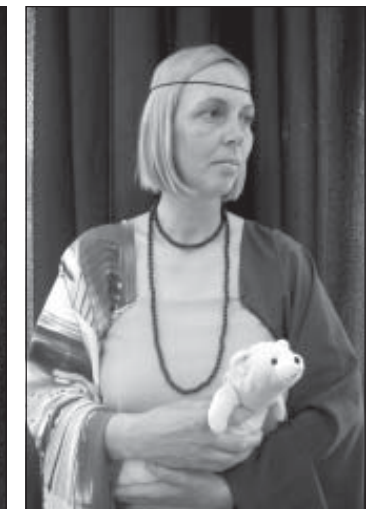
Leonardo Da Vinci: Hölgy hermelinnel