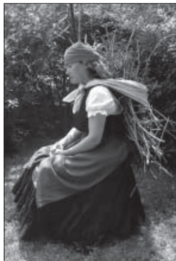
Munkácsy Mihály: Rőzsehordó nő